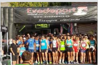
El Colegio en eventos deportivos: Carrera Popular de la Sandía en Velada. Pág. 19