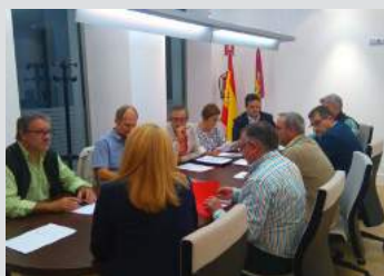
Reunión Colegios Profesionales Sanitarios de Albacete. Pág. 14