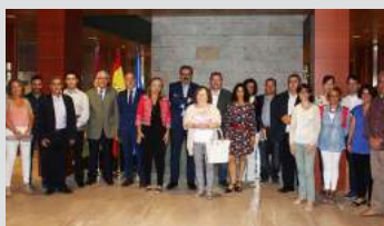
Red de Expertos y Profesionales en Educación para la Salud y Escuelas de Pacientes de Castilla - La Mancha Pág. 13