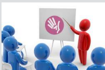
Próximos cursos de formación para los colegiados de COFICAM. Págs. 21-22